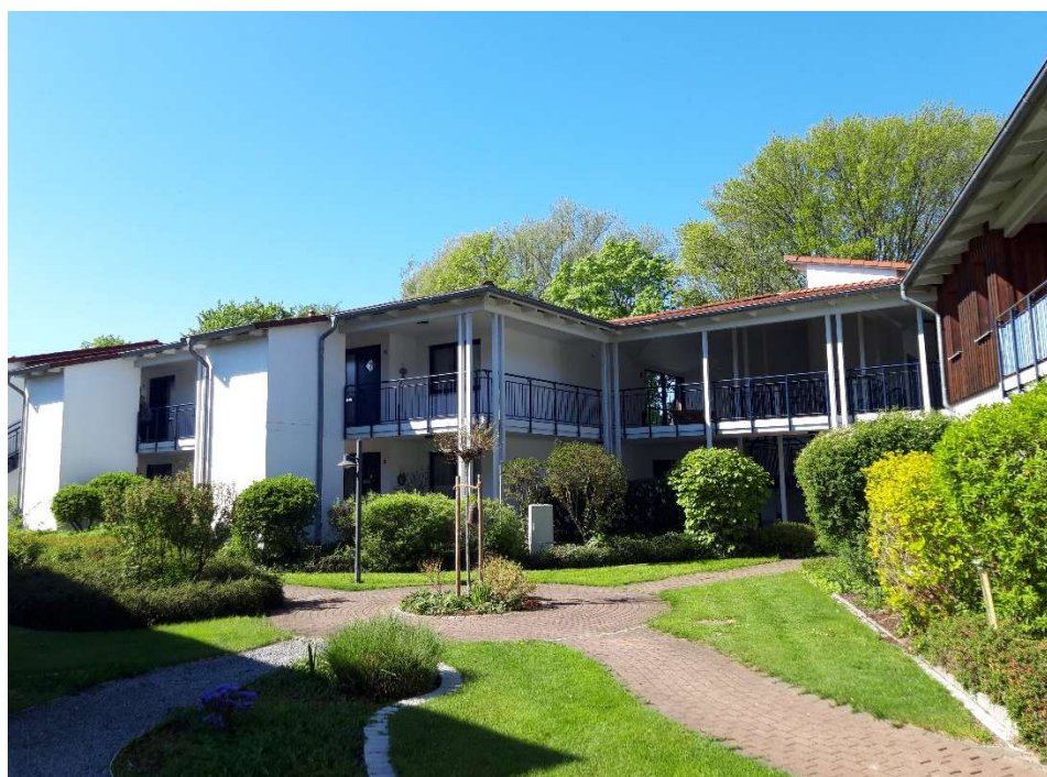
Wohnen im lebenswerten DRK-Quartier „Ilmenauwiesen“

Es wird gewünscht die Ergebnisse des Audits zum „Sicheren Wohnen“ dabei ebenso zu überprüfen wie die Ergebnisse zur Zertifizierung des „Lebenswerten Quartiers“ und beides in Zukunft zusammen weiterzudenken.