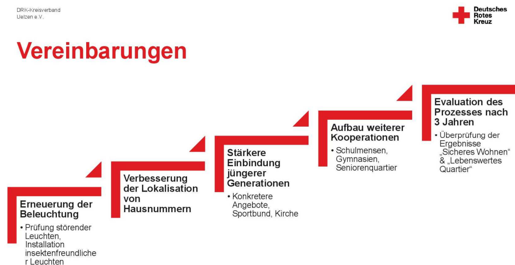
Abb. 4: Präsentation DRK-Kreisverband Uelzen e.V.