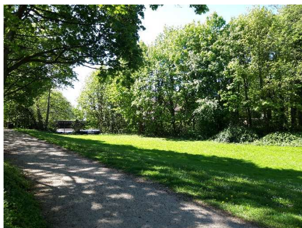
Terrasse des Mehrgenerationenhauses im DRK-Quartier mit Blick auf die „Ilmenauwiesen“ Uelzen